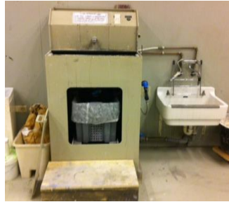
Studio 1 & werkplaats